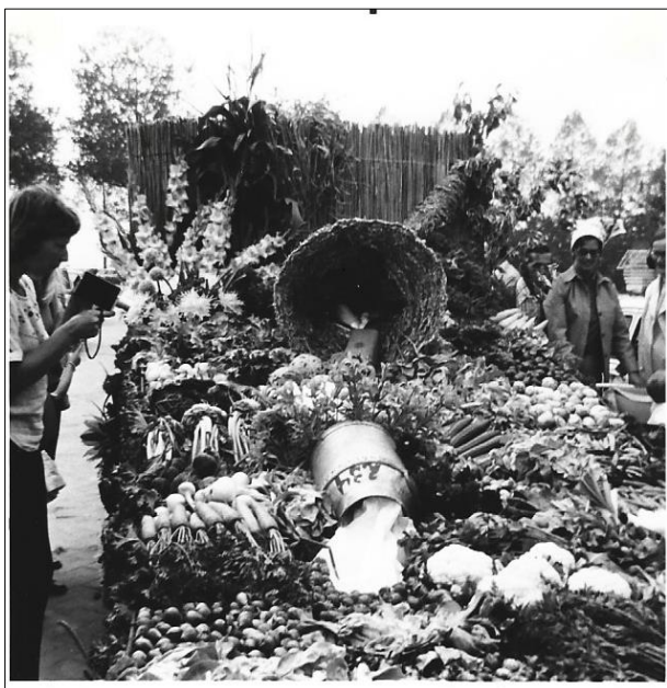
Versierde wagen Ensyfair 1974 Drietorensweg-Zuid "Hoorn des overvloeds"