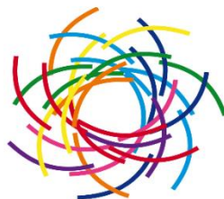
O.B.S. De Regenboog